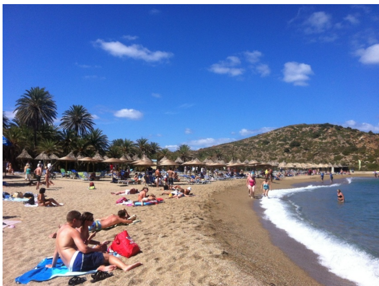
Εικόνα 1. Η παραλία στο Βάι του Δήμου Σητείας.

Το Βάι βρίσκεται στα ανατολικά παράλια της Κρήτης, ανήκει διοικητικά στο Δήμο Σητείας και είναι παγκοσμίως γνωστό σαν τη μοναδική παραλία της Ευρώπης με τους φοίνικες νάνους. Πρόκειται για το μεγαλύτερο σε έκταση, φοινικόδασος της ηπείρου, μια επιφάνεια 250 τ.χλμ, με φοινικόδεντρα που φτάνουν ως τη θάλασσα. Το φοινικόδασος στο Βάι αποτελεί έναν από τους πιο δημοφιλείς τουριστικούς προορισμούς της Κρήτης και έτσι η παραλία δέχεται σημαντικό αριθμό επισκεπτών κατά τους καλοκαιρινούς μήνες.